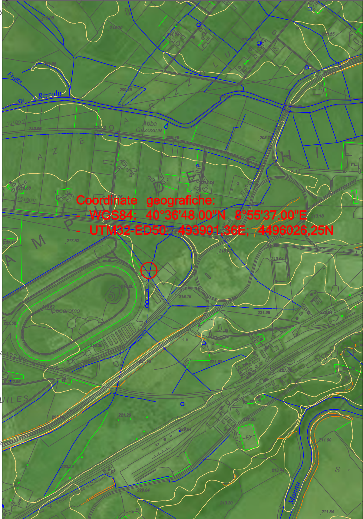
Inquadramento CTR - Scala 1:10000