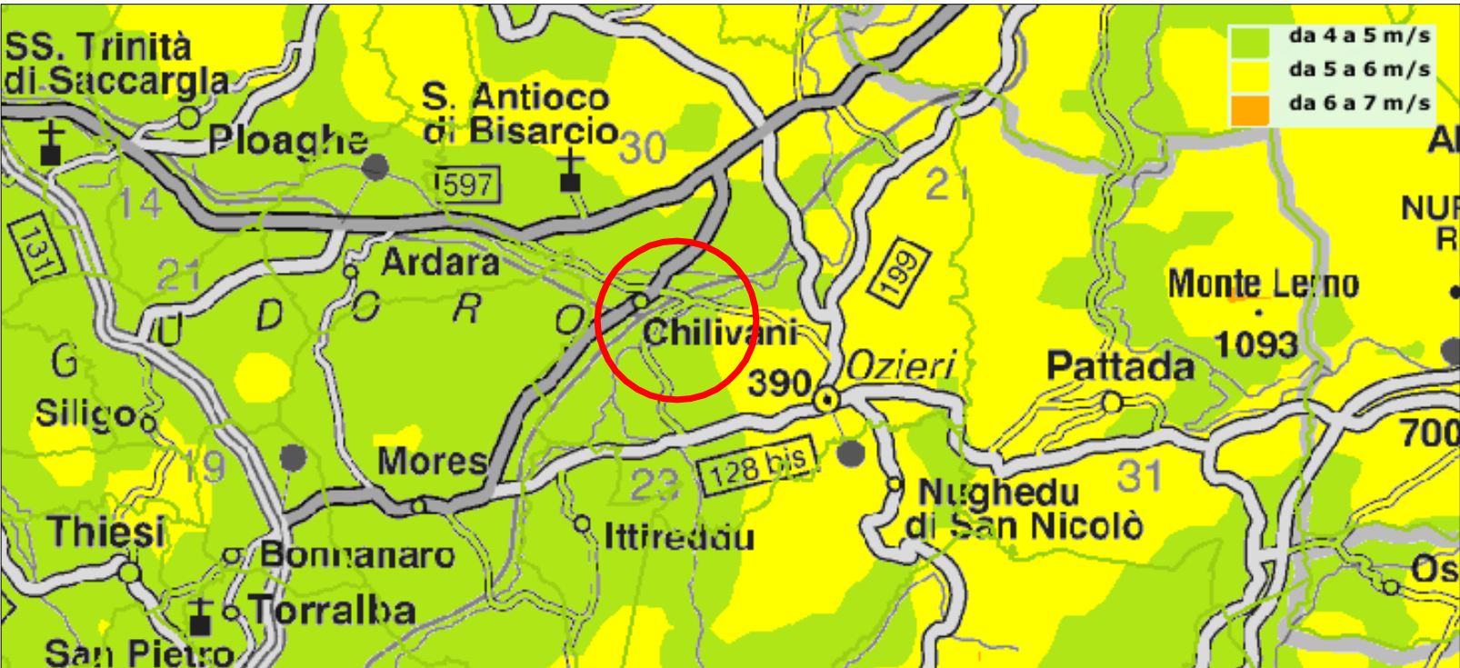
Inquadramento ATLANTE EOLICO - Velocità media annua del vento a 25 s.l.m./s.l.t.