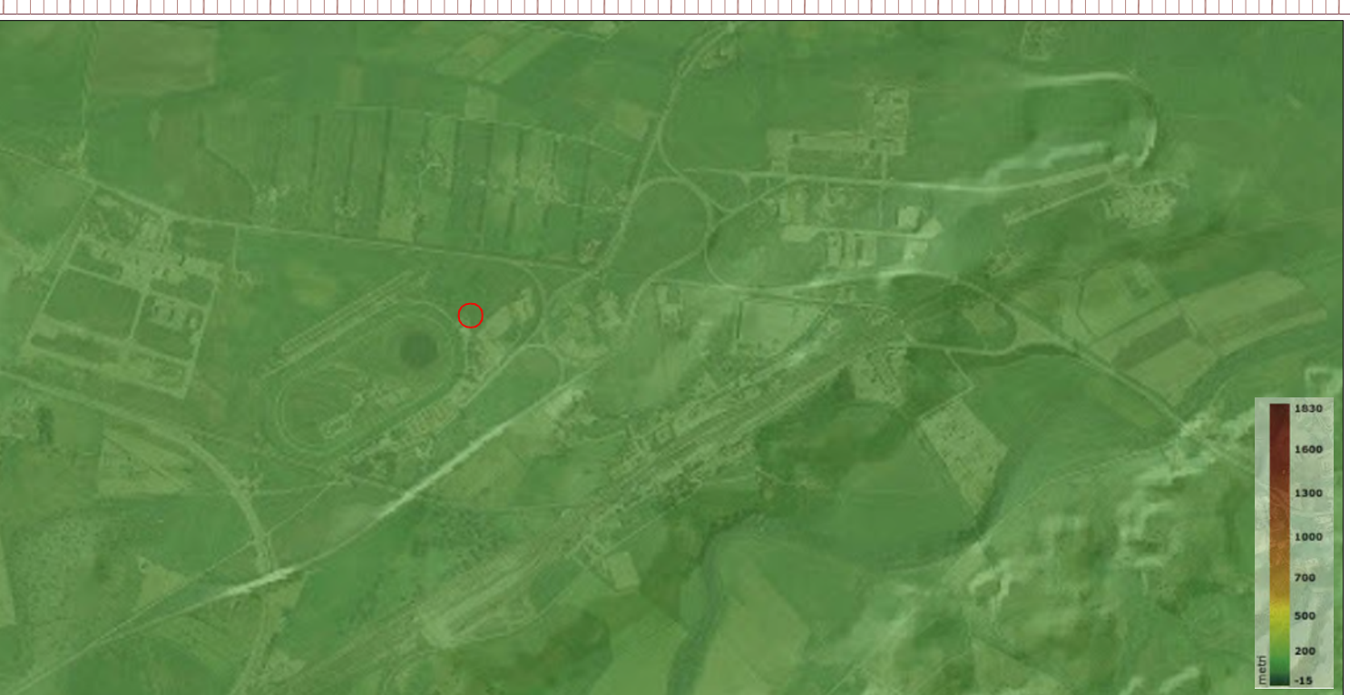
DTM su ortofoto - Scala 1:20000